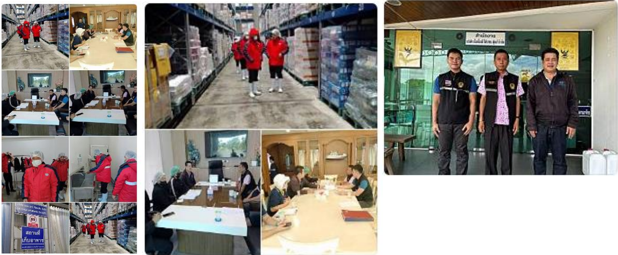
ข่าวประชาสัมพันธ์ สำนักงานปศุสัตว์จังหวัดสมุทรสาคร

สำนักงานปศุสัตว์จังหวัดสมุทรสาคร ที่อยู่ ซอยเรือเงิน่า ถนนธรรมคุณากร ตำบลโกรกกราก อำเภอมืองสมุทรสาคร จังหวัดสมุทรสาคร 74000 โทรศัพท์ 034 412600 โทรสาร 034 412600 ไปรษณีย์อิเล็กทรอนิกส์ pvlo_sms@dld.go.th